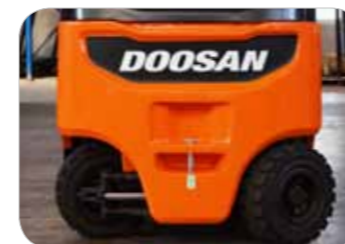
Optimierter Lenkwinkel BT (3-Rad): 90° BX (4-Rad): 86°