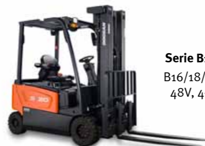
Serie B18X-7 B16/18/20X-7 48V, 4-Rad