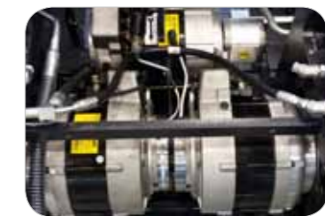
Zuverlässiger, leistungsstarker Antriebsmotor Schutzklasse IP43