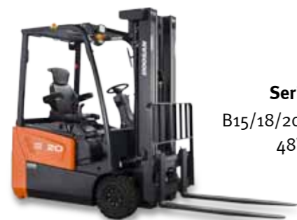
Serie B18T-7 B15/18/20T-7, B18/20TL-7 48V, 3-Rad