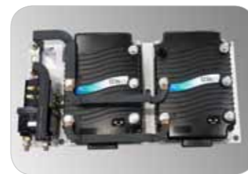
Stabiler und zuverlässiger Betrieb durch Curtis Steuerung Schutzklasse IP65