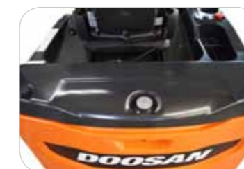
Neues, abgerundetes Design des Kontergewichts